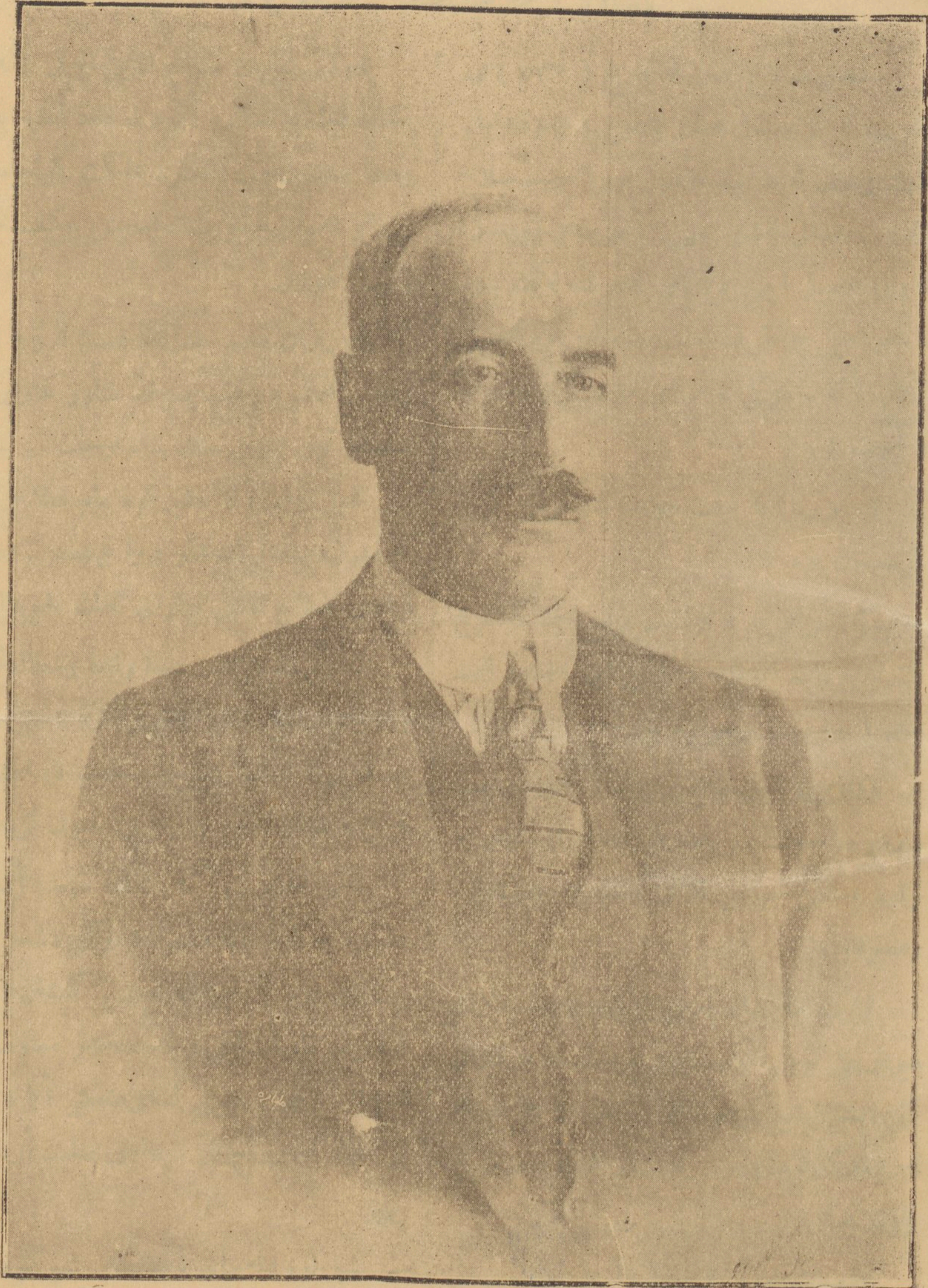
مندوب سامی؛ فخامت مآب جناب عالی (سیر هاری دویس)

بنگلی ہرنگاندن ویلکولینروہی ٹرن مرکز زین للتوثیق والدراسات Zheen Center For Documentation & Research